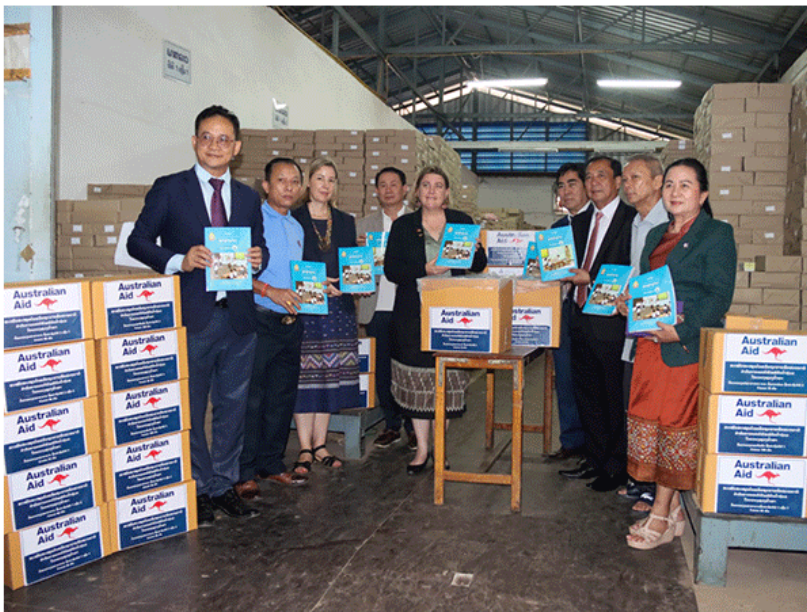
A delegation from the Australian Embassy and the Ministry of Education and Sports observes the packing of textbooks for dispatch to Luang Namtha province.

Primary schools in three flood-hit districts of Luang Namtha province have received 7,740 textbooks and 1,530 teacher guides from Australia to replace materials lost during severe floods in September.