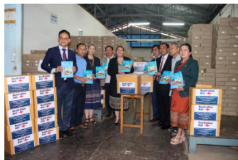
Australia Embassy and MoES delegation observe packing of textbooks for Luang Namtha province

A recent report from the Disaster Management Task Force of the Ministry of Education and Sports indicates that the damage caused by Typhoon Yagi in September 2024 affected 1,800 primary students and teachers in 17 primary schools in Namtha, Nalae and Sing districts. Textbooks, teaching materials, desks, computers and experiment tools, and water dispensers were severely damaged beyond repair.