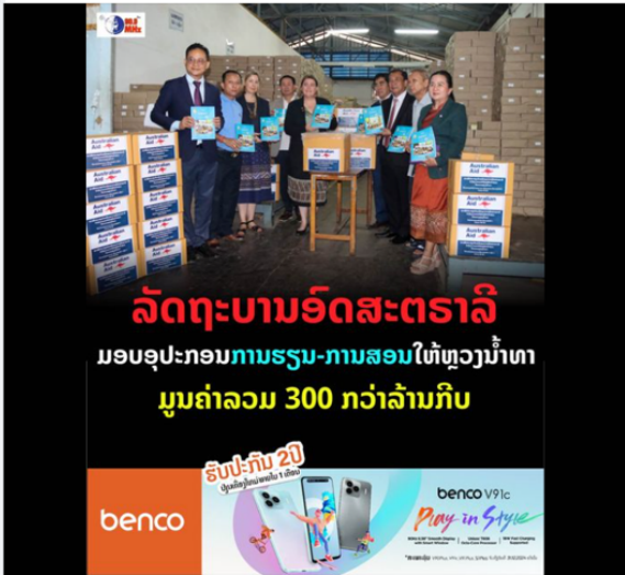
You, Lao Youth Radio FM 90.0 Mhz and 45 others 1 share

ວິທະຍາໄລ ອັງໄຂ October 24 at 4:40 PM · 🌐 ວັດຖຸບານອັດສະຕຣາລີ ມອບອຸປະກອນການຮຽນທີ່ຈຳເປັນເພື່ອຊ່ວຍເຫຼືອໂຮງຮຽນປະຖົມສຶກສາທີ່ໄດ້ຮັບຜົນກະທົບຈາກໄພນ້ຳຖ້ວມຢູ່ແຂວງຫຼວງນ້ຳທາ. https://bequal-laos.org/.../australia-delivers-essential.../ Yui Sithavong 1 share Like Comment Send Share