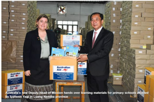
Australia's new Deputy Head of Mission hands over learning materials for primary schools affected by typhoon Yagi in Luang Namtha province.

Primary schools in the three most flood-affected districts in Luang Namtha province will receive 7,740 textbooks and 1,530 teacher guides to replace the Grade 1 to 5 materials lost in the floods