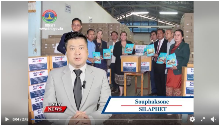
Australia provides essential learning materials to flood-affected primar...