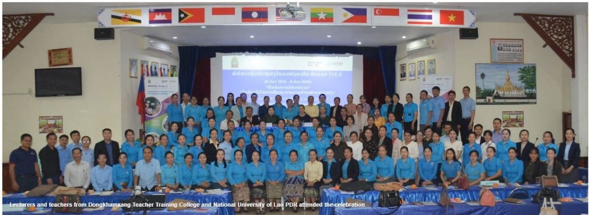
Lecturers and teachers from Dongkhamxang Teacher Training College and National University of Lao PDR attended the celebration