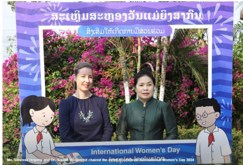
On the occasion of International Women's Day 2024, student-teachers and lecturers from the Dongkhamxang Teacher Training College discussed opportunities to boost women's empowerment in the education sector