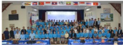
Lecturers and teachers from Dongkhamxang Teacher Training College and National University of the Lao PDR attended the celebration

(KPL) To celebrate International Women's Day (IWD), the Ministry of Education and Sports (MoES), with support from the Australian Government through the Basic Education Quality and Access in the Lao PDR (BEQUAL) program organised a half-day workshop at the Dongkhamxang Teacher Training College (TTC).