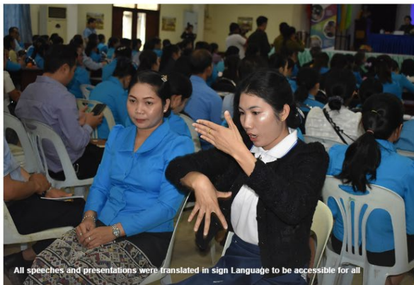
All speeches and presentations were translated in sign Language to be accessible for all

Teachers play a critical role in ensuring inclusion of all children, no matter their gender, ethnicity, or ability. But to ensure inclusion, you also need a safe environment for students. Workshop participants were therefore first introduced to the new Child Protection and Safeguarding brochure produced by MoES with support from Australia. They reflected on how they could ensure all students, girls and boys, can access education in an inclusive and safe environment that supports them to thrive. They discussed the Do's and Don'ts of child protection and created posters on practical actions that should be followed by all teachers.