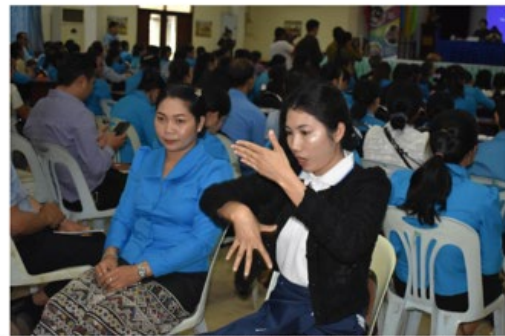
All speeches and presentations were translated in sign Language to be accessible for all

"I am looking forward to seeing how as teachers and future teachers, you will put into practice those messages of child protection, women's empowerment and inclusion, and build a more equitable and inclusive society for generations to come," Ms. Sisouk Vongvichit concluded.