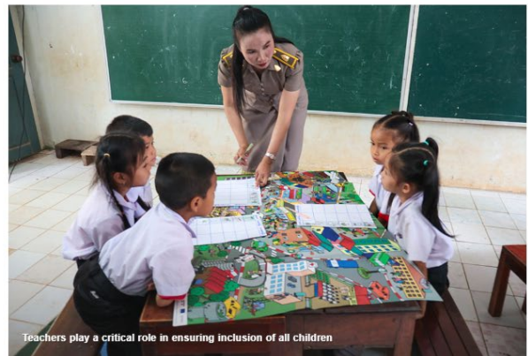
Teachers play a critical role in ensuring inclusion of all children

After that, they participated in a panel discussion on "promoting gender equality and supporting women's advancement". Six panelists shared their personal stories of empowerment and inclusion. Teachers and students shared their experience from attending the inclusive education specialisation subject and how they know understand that each student learn differently and have their own specific characteristics. They raised that the most important factor is the motivation and devotion of the teachers and their will to continue learning to constantly develop their teaching skills. Moreover, teachers invited to the event also shared their experience on their inclusive education practice, and how to create a safe zone to ensure all girls can access education fairly and equally.