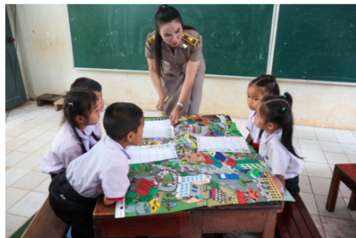
Teachers play a critical role in ensuring inclusion of all children

"International Women's Day gives us an opportunity to talk about what remains to be done in our efforts to achieve gender equality and call for positive change for women's empowerment. Australia is proud to support the Ministry of Education and Sports to raise future teachers' awareness of the importance of women's advancement and child protection. Australia's commitment to gender equity and inclusive education in Laos underpins our long-standing partnership with the Government of the Lao PDR to achieve equal access for all children to quality primary education," Ms Hegarty added.