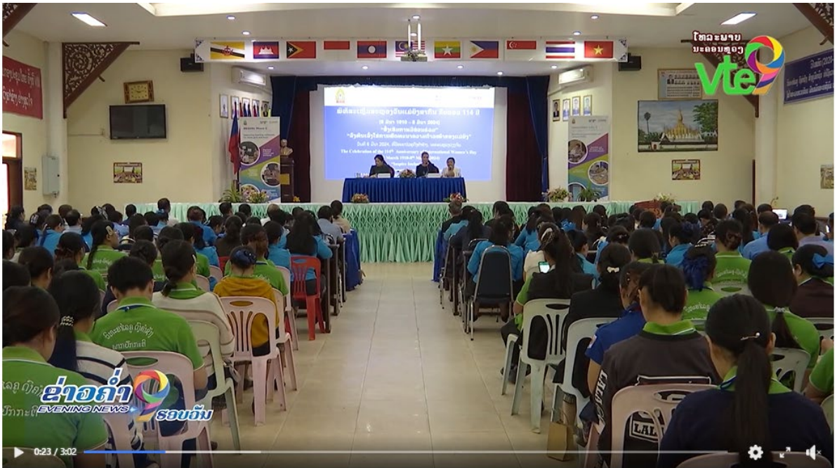
ປຸກຈິດສໍານຶກວຽກງານສ້າງຄວາມເຂັ້ມແຂງຂອງແມ່ຍິງ