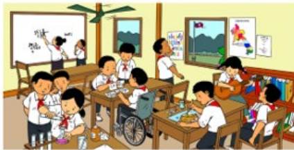
The revised curriculum developed with support from Australia promote more gender equity and inclusion

(KPL) To celebrate International Women's Day (IWD), the Ministry of Education and Sports (MoES), with support from the Australian Government through the Basic Education Quality and Access in the Lao PDR (BEQUAL) program organised a half-day workshop at the Dongkhamxang Teacher Training College (TTC).