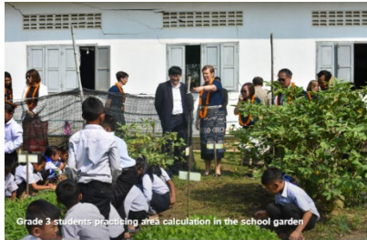
Grade 3 students practicing area calculation in the school garden