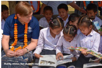
During breaks, the students enjoy reading

BEQUAL is a program led by the Lao Government with support from the Australian Government and the United States Agency for International Development (USAID). The program focuses on enhancing educational outcomes for the nation's youth, especially the vulnerable and disadvantaged. BEQUAL will also continue to focus on ensuring gender equality and promoting inclusive education across all activities.