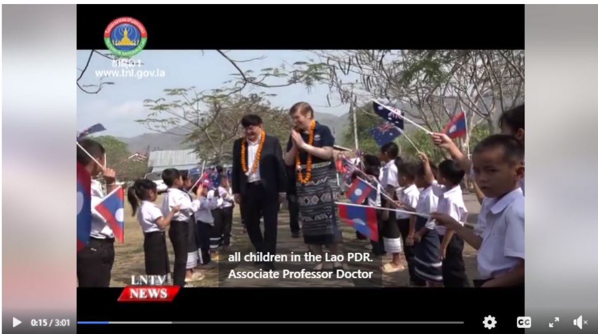
The Australia's Ambassador to Lao PDR visits a primary school in Kham district...