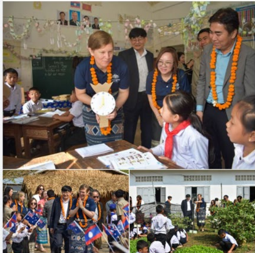
16 3 shares