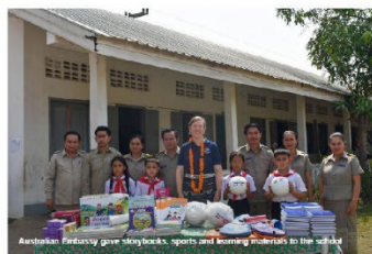
Ambassador Jones gave storybooks, sports and learning materials to the school