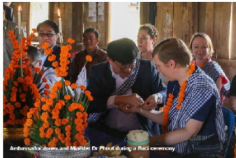
Ambassador Jones and Minister Dr Phout giving a Blessing ceremony