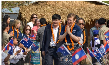
Australia's Ambassador and Lao PDR's Minister for Education and Sports observe classes with the revised national primary curriculum in action