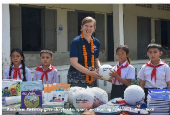
Ambassador Jones gave storybooks, sports and learning materials to the school