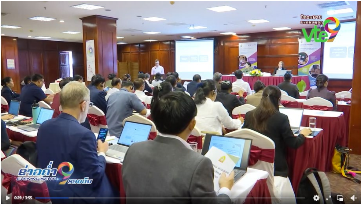
2 ພາກສ່ວນ ໄດ້ເລີ່ມຕົ້ນຈັດຕັ້ງປະຕິບັດມາດຕະຖານການສອນຊັ້ນປະຖົມສຶກສາແຫ່ງຊາດ ສະບັບ...