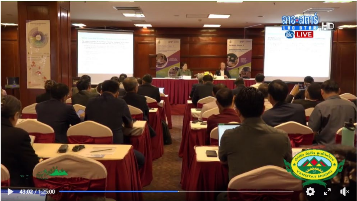
🔴 LIVE ຂ່າວພາກເຊົ້າ 23-02-2024 ເວລາ 06:00-07:00 ໂມງ