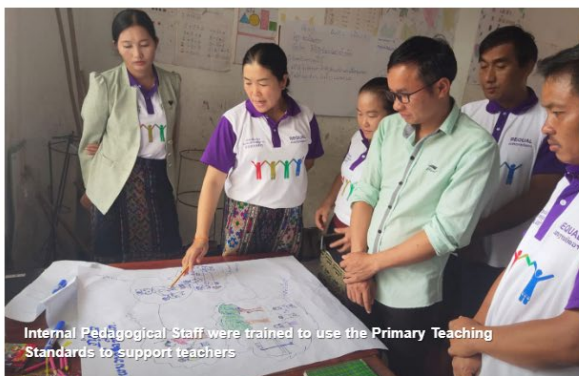
Internal Pedagogical Staff were trained to use the Primary Teaching Standards to support teachers