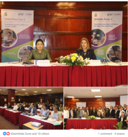
👤 khamthilat Sone and 10 others 1 comment 4 shares