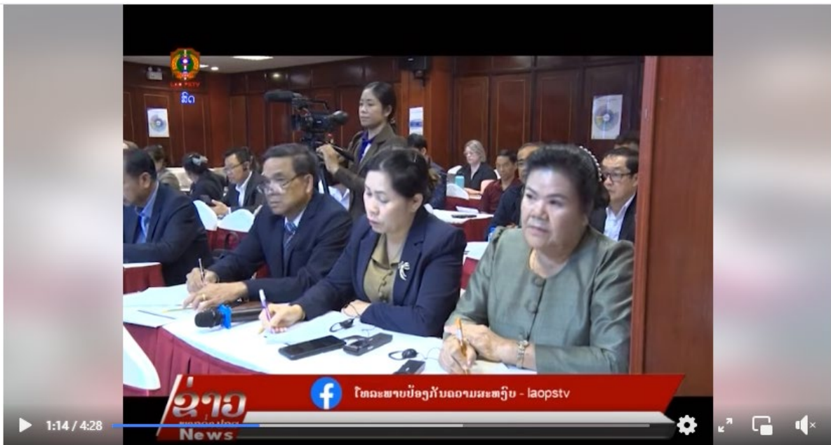
LAO PSTV22/02/2024: ກະຊວງ ສຶກສາທິການ ຮ່ວມກັບ ລັດຖະບານອິດສະຕຣາລີ ເລີ່ມຕົ້ນຈັດຕັ້ງປະຕິບັດມາດຕະຖານການສອນ ຊັ້ນປະຖົມສຶກສາແຫ່ງຊາດ ສະບັບປັບປຸງ...