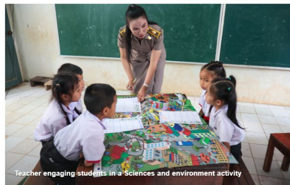
Teacher engaging students in a Sciences and environment activity

In 2023, DTE with the support of the Australian Government and the United States Agency for International Development (USAID) through the BEQUAL program, led a technical working group with representatives from across MoES to revise the Primary Teaching Standards. The objective was to align the standards with the revised primary curriculum and MoES’ new system for continuing professional development (CPD). The Primary Teaching Standards were approved by the Vice Minister Dr. Sisouk Vongvichit in November 2023. Australia supported the printing and distribution of the standards to central level departments, all eight TTCs, 18 Provincial Education and Sports Services, 148 District Education and Sports Bureaus, and teachers and principals nationwide.