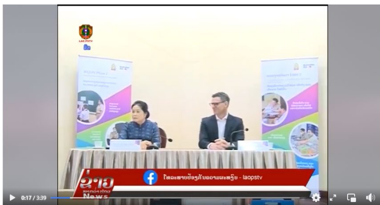
LAO PSTV 7/03/2023: ກະຊວງສຶກສາທິການ ແລະ ກິລາ ແລະ ແຜນງານບໍລິຄໍາ ສະເຫຼີມສະຫຼອງວັນແມ່ມິຊຸສາກົນ

ໂທລະພາບປ້ອງກັນຄວາມສະຫງົບ - laopstv March 7 at 1:06 PM · 🌐