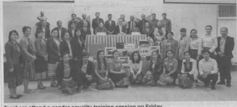
Teachers attend a gender equality training session on Friday.