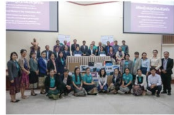
Ambassador Paul Kelly said, "Videos and digital resources can play a vital role in ensuring equitable access to information for students and teachers. Digital resources can also promote the concept of 'no one left behind'. Therefore, one aspect of Australia's support to teacher professional development in the Lao PDR is equipment and training to create and produce digital learning resources for teachers.

The Australian Government also supports DSE with the "Role Models" documents which aim to motivate and inspire teachers and educational staff to replicate good teaching and inclusive education practices in the classroom. The documents episodes are disseminated via interviews on ESTV, radio, newspaper and social media.