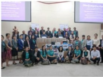
Teachers attend a gender equality training session on Friday. education ministry's digital and video productions.

Home About Us Lao Chinese Facebook Page Videos Clips Previous E-Paper Links Partners Advertise Subscribe Payments Log In