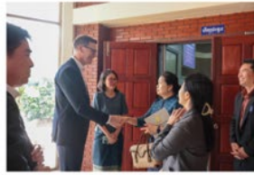
The Australian Government through the Basic Education and Quality and Access in the Lao PDR (BEQUAL) programme, provides technical and financial support to produce teacher development videos for the E-Learning team of RIES.