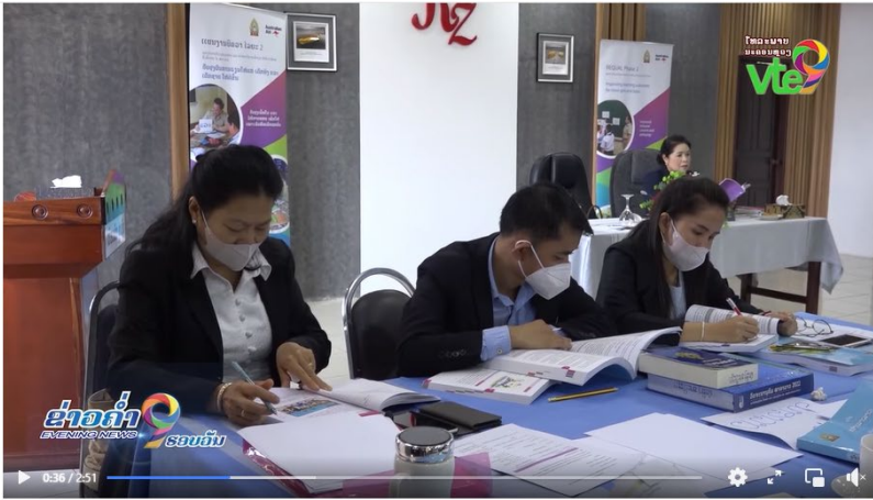
ກະຊວງ ສສກ ອະນຸມັດປຶ້ມແບບຮຽນ ປ.5 ແລະ ຄຸ້ມຄຸ ສະບັບປັບປຸງໃໝ່

Vte9 Channel ໄທລະພາບນະຄອນຫຼວງວຽງຈັນ 20h · 🌐 Following