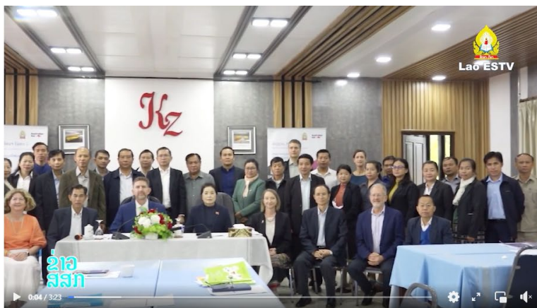
ກອດຜ່ານ ແລະ ຮັບຮອງເລື້ອໃນຜູ້ກຊຸດ, ປຶ້ມແບບຮຽນ ແລະ ຄຸ້ມຄຸ ປ.5 ສະບັບປັບປຸງໃໝ່

Edu-Sport TV online February 3 at 5:58 PM · 🌐 Follow