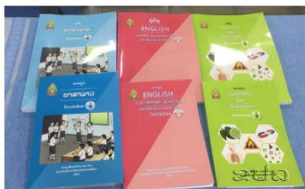
New textbooks for Lao Language, Science and Environment and English with the support of Australia