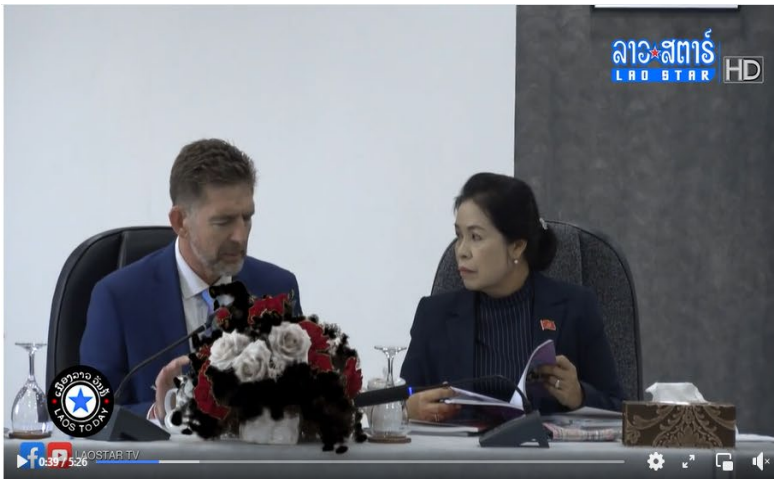
ປຶ້ມແບບຮຽນ ປ.5 ແລະ ຄຸ້ມຄຸ ສະບັບປັບປຸງໃໝ່ ທີ່ໄດ້ຮັບການພັດທະນາຈາກ ລັດຖະບານອິດສະ...

ໄທລະພາບ ລາວສະຕາລ໌ Lao Star Tv February 3 at 3:30 PM · 🌐 Follow