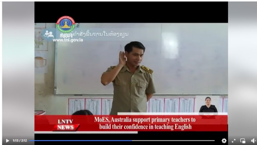
MoES, Australia support primary teachers to build their confidence in teaching Engl...

Lao National Television-English News Program October 8 at 9:38 AM · 🌐