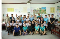
The production and filming team with the actors

To further support the primary teachers, the new English curriculum for grades three to five developed by RIES with support from Australia has been designed in a way to make teaching and learning English easier for teachers and students. The topics and language that are covered in the lessons are relevant to students' daily lives. For example, talking about family, food and hobbies. The English curriculum also includes audio tracks which are provided to teachers on both a USB device and also uploaded onto the Teacher Development YouTube channel. Teachers can use the audio tracks to improve their own English and also in class with students.