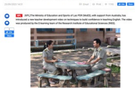
Learning classroom interaction with your colleague

MoES, the Ministry of Education and Sports of Lao PDR (MoES), with support from Australia, has introduced a new teacher development video on techniques to build confidence in teaching English. The video was produced by the E-learning team of the Research Institute of Educational Sciences (RIES).