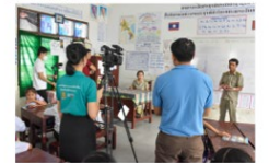
Filming of new teacher development video

English is a global language widely used by speakers of different languages to communicate with one another. To be able to engage and participate in the modern world, students need to develop basic speaking, listening, reading and writing skills in English. With a basic understanding of English, students will have more opportunities in their future. For that reason, MoES starts English instruction in primary school as early as grade three.