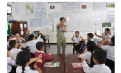
Teacher confidently teaching English phrases