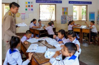
Teacher organizing group activity in a multi-grade classroom

ມາດຕະຖານການສອນຊັ້ນປະຖົມສຶກສາ ໄດ້ຖືກຕີເລືອກເຊັນດາລາວຊັ້ນປະຖົມສຶກສາ ຊັ້ນເລີດເລີ່ມຄັ້ງ ປີ 1-5 ຂອງ ສາທາລະນະລາວ ແລະ ສາ ສາ (ສາ) ໄດ້ຮັບການອະນຸຍາດສອນຊັ້ນປະຖົມສຶກສາ ໂດຍໄດ້ຮັບການສະໜັບສະໜູນຈາກ ດັງຊາບາອິດເອເຊຍ ແລະ ດັງຊາບາອິດເອເຊຍ (USAID) ໂດຍຜ່ານ ສາທາລະນະລາວ ມາດຕະຖານການສອນຊັ້ນປະຖົມສຶກສາ ໄດ້ຮັບການອະນຸຍາດ ສາ ສາ ສາ ດັງຊາບາອິດເອເຊຍ ຂອງ ສາ ໂດຍເລີດເລີ່ມຕົ້ນ ຄ.ສ 2023.