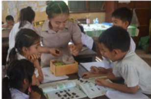
Teacher engaging students in Lao Language activity