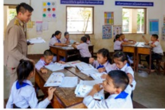
Teacher organizing group activity in a multi-grade classroom