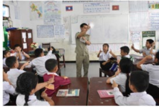
Teacher confidently teaching English Phonics

KPL Following the major reform of the primary school curriculum and the completion of the roll out of the curriculum for Grades 1-5, the Ministry of Education and Sports of the Lao PDR (MoES) has revised the Primary Teaching Standards with the support of Australia and the U.S. Agency for International Development (USAID), through the BEQUAL program.