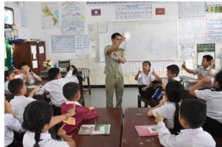
09/11/2023 / 8M Salya

ສາວອຸງຖາມາດຕະຖານການສອນຊັ້ນປະຖົມສຶກສາ ແລະ ການເລືອກເຊັນດາລາວຊັ້ນປະຖົມສຶກສາ ຊັ້ນເລີດເລີ່ມຄັ້ງ ປີ 1-5 ຂອງ ສາທາລະນະລາວ ແລະ ສາ ສາ (ສາ) ໄດ້ຮັບການອະນຸຍາດສອນຊັ້ນປະຖົມສຶກສາ ໂດຍໄດ້ຮັບການສະໜັບສະໜູນຈາກ ດັງຊາບາອິດເອເຊຍ ແລະ ດັງຊາບາອິດເອເຊຍ (USAID) ໂດຍຜ່ານ ສາທາລະນະລາວ ມາດຕະຖານການສອນຊັ້ນປະຖົມສຶກສາ ໄດ້ຮັບການອະນຸຍາດ ສາ ສາ ສາ ດັງຊາບາອິດເອເຊຍ ຂອງ ສາ ໂດຍເລີດເລີ່ມຕົ້ນ ຄ.ສ 2023.