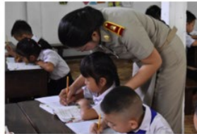
Teacher supporting student individual learning needs

The Primary Teaching Standards will have many uses linked to continuing professional development (CPD) activities. They provide a clear guide for those designing and providing CPD support for teachers so that it fully aligns with the knowledge, skills and values required by teachers to improve student learning outcomes. The teachers will be able to use the standards to support their own professional development as they engage in ongoing self-assessment and goal setting for their CPD.