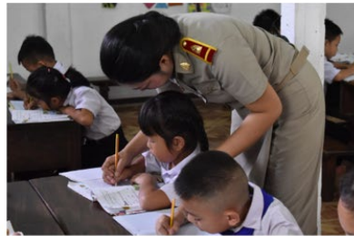
Teacher supporting student individual learning needs