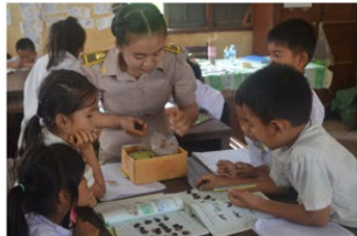
Teacher supporting student individual learning needs