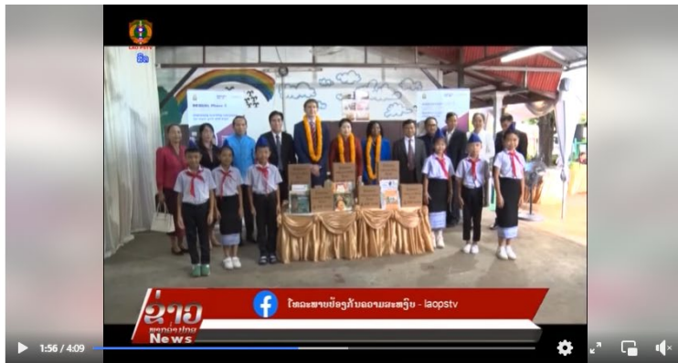
LAO PSTV 18/09/2023: ລັດຖະບານອົດສະຕຣາລີ ແລະ ອົງການ USAID ສົບຕໍ່ຮ່ວມມືຄັ້ງໃໝ່ ເພື່ອສະໜັບສະໜູນ ກະຊວງສຶກສາທິການ ແລະ ກິລາ ແຫ່ງ ສປປ ລາວ

ໄທວະພາບປ້ອງກັນຄວາມສະຫງົບ - laopstv September 19 at 10:27 AM · 🌐