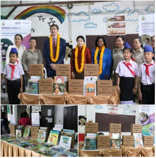
21 10 shares