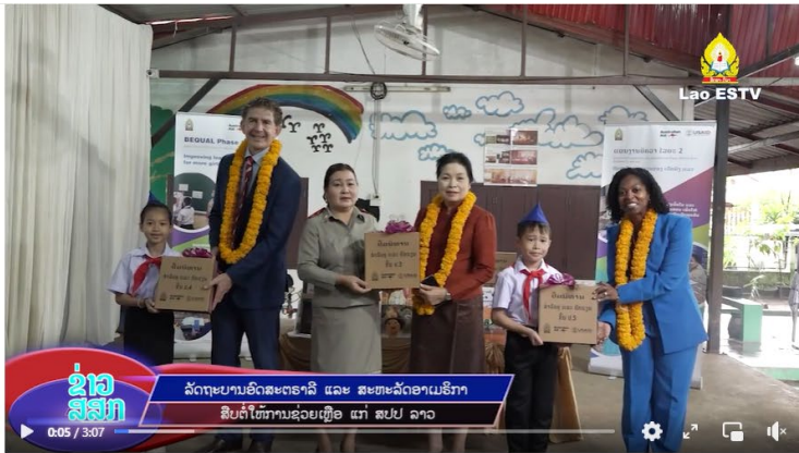
ລັດຖະບານອັດສະຕຣາລີ ແລະ ສະຫະລັດອາເມຣິກາ ສົບຸ້ນໃຫ້ການຊ່ວຍເຫຼືອແກ່ ສ...

Like Comment Share Lamxe Liamsthisack and 20 others · 1 comment · 382 views