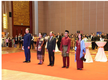
The Malaysian Ambassador to Laos, Mr. Edi Iwan Mahmod (second right), Laos' Deputy Minister of Foreign Affairs, Mr. Phouxy Khaykhamphouthoune (centre), other ambassadors, senior officials, members of the diplomatic corps and Malaysian nationals living in Laos gather in Vientiane on September 15 to celebrate Malaysia's 66th National Day on August 31, the 60th Malaysia Day on September 16, and the 90th Malaysian Armed Forces Day on September 16.