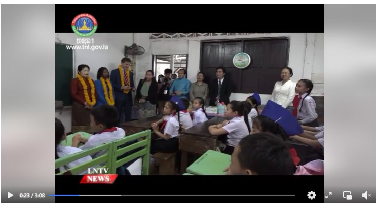
Australian Govt, USAID announce their new partnership to support MOES through BEQUAL

Lao National Television-English News Program September 20 at 6:19 PM · 🌐