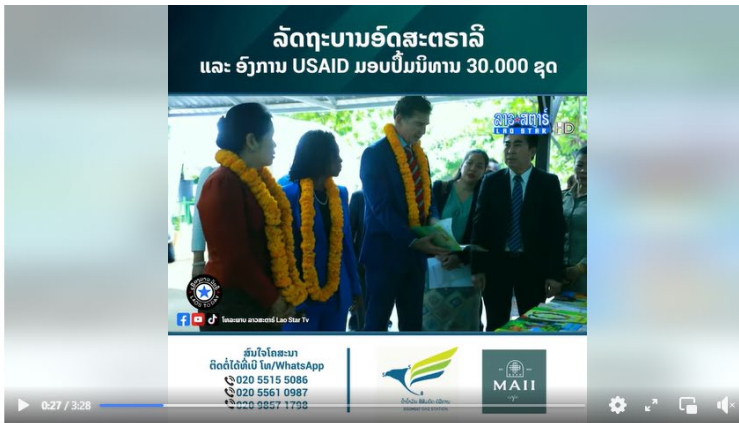
ລັດຖະບານອັດສະຕຣາລີ ແລະ ອົງການ USAID ມອບປຶ້ມນິທານ 30.000 ຊຸດ