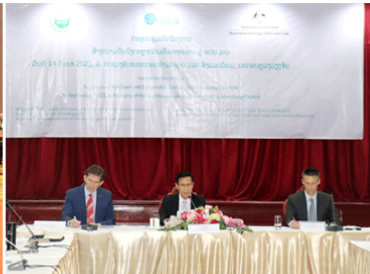
Officials from the Department of Climate Change at the Ministry of Natural Resources and Environment and staff from the Global Green Growth Institute meet to discuss the programme for Open Sustainable Carbon Markets in Laos, funded by Australia's Department of Foreign Affairs and Trade. The project aims to create a coordinated multi-sectoral framework for sustainable participation in international carbon markets in Laos, in order to increase the flow of carbon finance into the country, facilitating carbon sequestration and emissions reduction projects. Key objectives of the project are to strengthen policy, institutions and systems for open and sustainable participation in international carbon markets; build capacity, awareness, research and coordination among market participants; and enhance Laos' pipeline of carbon sequestration and emissions reduction projects under Article 6 of the Paris Agreement.