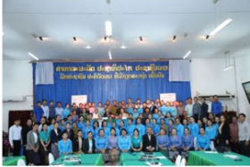
(KPL) The newly established team attended a five-day workshop on gender mainstreaming and School Related Gender-Based Violence that culminated with a celebration of Lao Women's Union Day.

KPL The newly established team attended a five-day workshop on gender mainstreaming and School Related Gender-Based Violence that culminated with a celebration of Lao Women's Union Day.