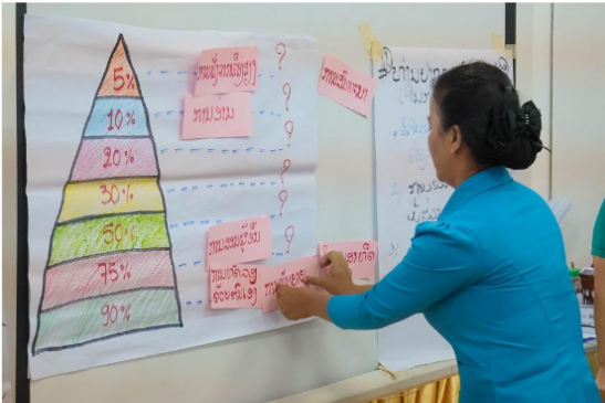
Ministry of Education and Sports, with support from Australia and the United States of America establishes a 'Master Gender Trainers' team for MoES Departments.

#TetraTech #InternationalDevelopment #Education