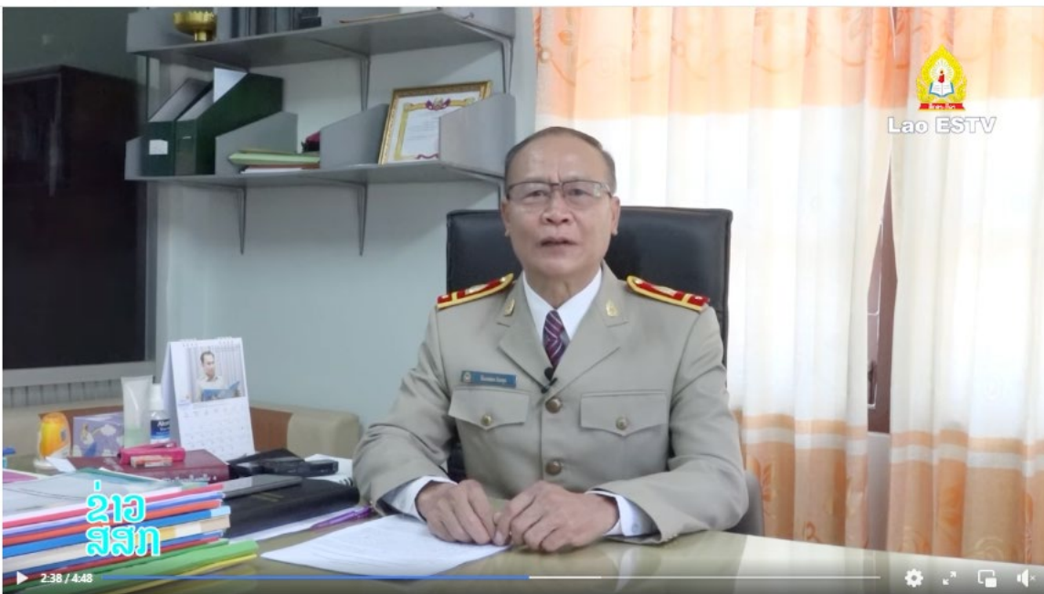
ສກຂ ສະຫວັນນະເຂດ ສົ່ງເສີມບັນຊາຮຽນທີ່ຈັບ ມ.ຕົ້ນ ເຂົ້າຮຽນສາຍວິຊາຊີບຄູ