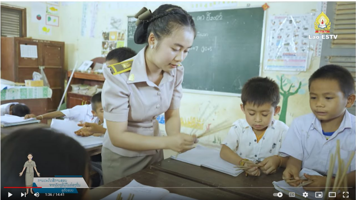
ສາວະຄະດີຄູດ້ວຍ 4: ການປະດິດສິການສອນ ຈາກວັດສະດຸໃນທ້ອງຖິ່ນ