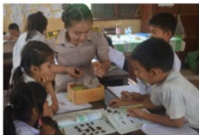
Doing maths for Lao Lomphouat lesson.

KPL For the fourth episode of the Role Model docuseries, the TV, radio and newspaper teams from the Information Media Centre (IMC) of the Ministry of Education and Sports (MoES) tell the story of an inspiring public school teacher who is a master at creating teaching and learning resources using no-cost local or recycled materials. Locally made teaching and learning resources is the topic of the new Role Model docuseries episode that has just been released on TV, radio and YouTube.