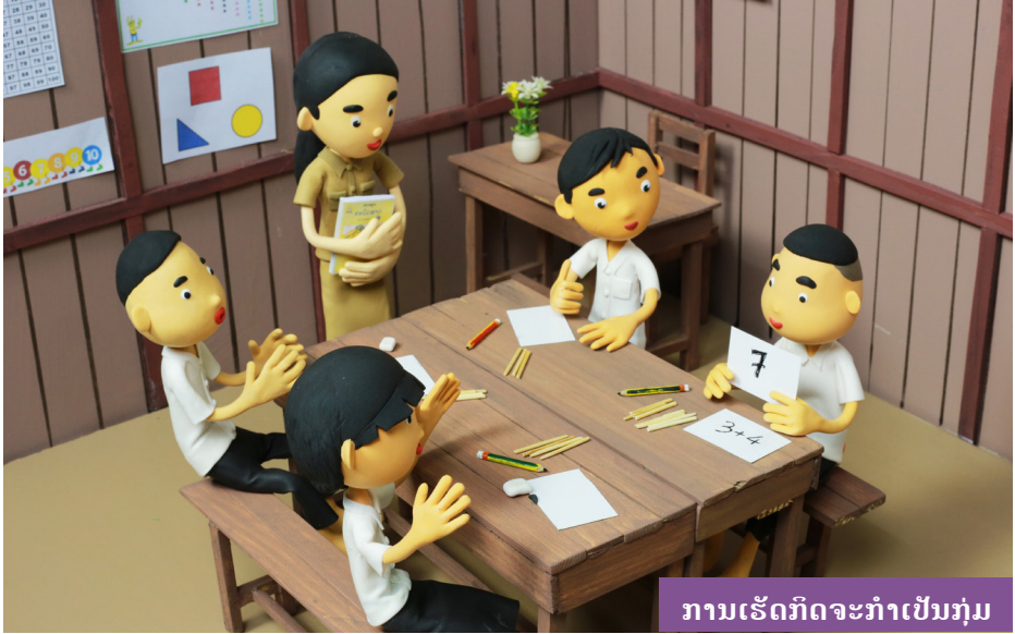
ການເຮັດກິດຈະກຳເປັນກຸ່ມ