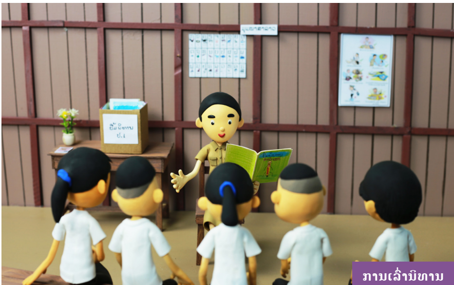
ການລ່າມິທານ