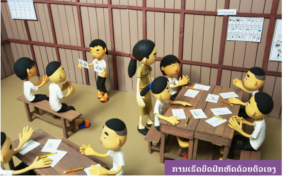
ການເຮັດບົດຝຶກຫັດດ້ວຍຕົວເອງ