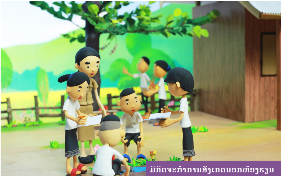
ມີກິດຈະກຳການສັ່ງເກດນອກຫ້ອງຮຽນ